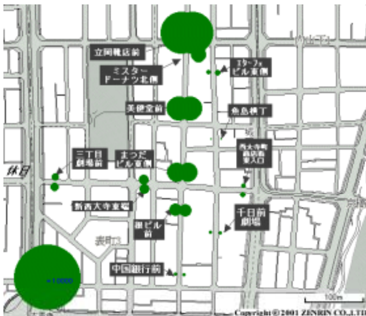
( 円グラフで表町 3 丁目付近の休日 9 時間合計の様子 )

http://www.osu.ac.jp/~tanaka/mapd/index.html